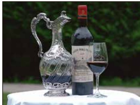
KLENODIUM: Denne vinkaraffelen har vært i familiens eie i årtier, og brukt 8000 søndager.