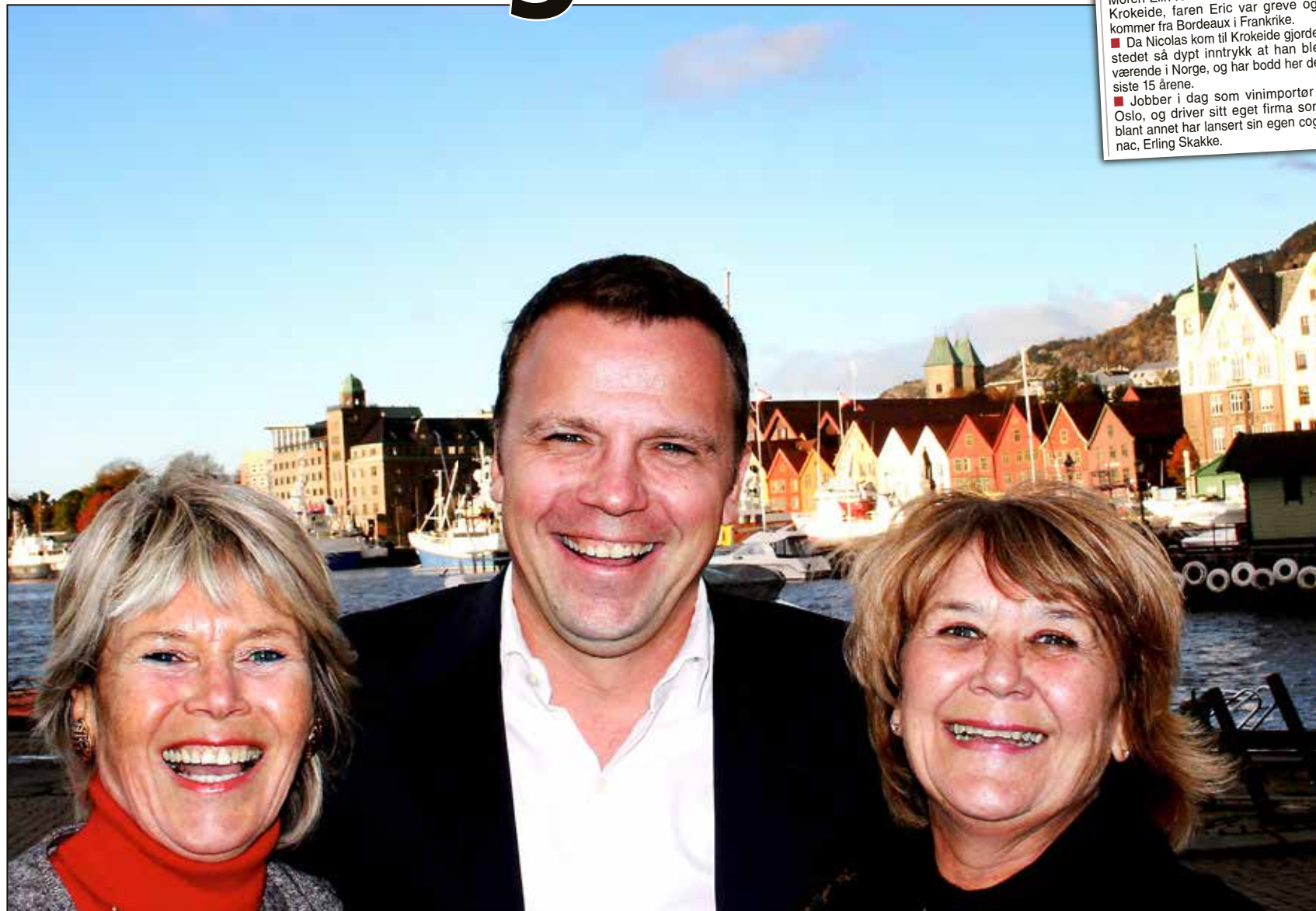
ENDELIG «HJEMME»: – Fantastisk å være i Bergen igjen, mener signerer han boken sin. I Bergen, selvsagt.